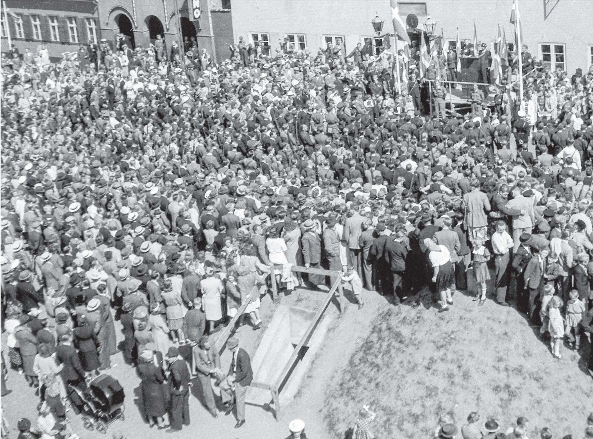
Rønne Torv 5. maj 1945.