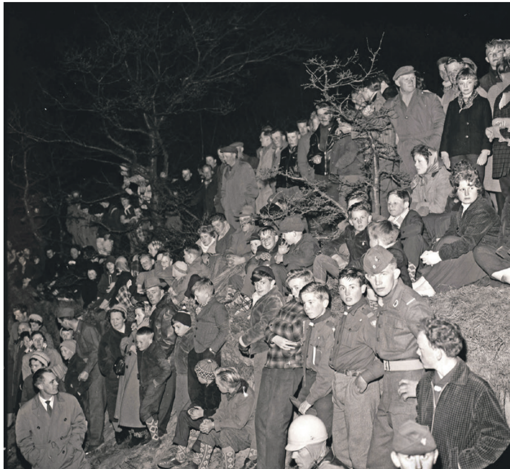
4. maj 1960 i Simblegårdsbakkerne.

sker i Rønne for på festlig vis at mindes 10-årsdagen for 4. maj med taler, hornorkester, fakler og optog. Der var lignende og omfattende arrangementer flere andre steder på øen. Fx deltog omkring 1000 mennesker i Allinge, hvor der var fakkeloptog, kirkeklokkekeringning og aftengudstjeneste. Og i Åkirkeby kunne kirken ikke rumme alle deltagerne. Ved Davidstatuen samlede en stor skare mennesker trods den silende regn. I reportagen fra Hasle skrev avisen: "... om aftenen strålede lysene ud fra næsten hvert et hus og hjem, og aldrig tidligere har Hasle by været så strålende illumineret med levende lys".